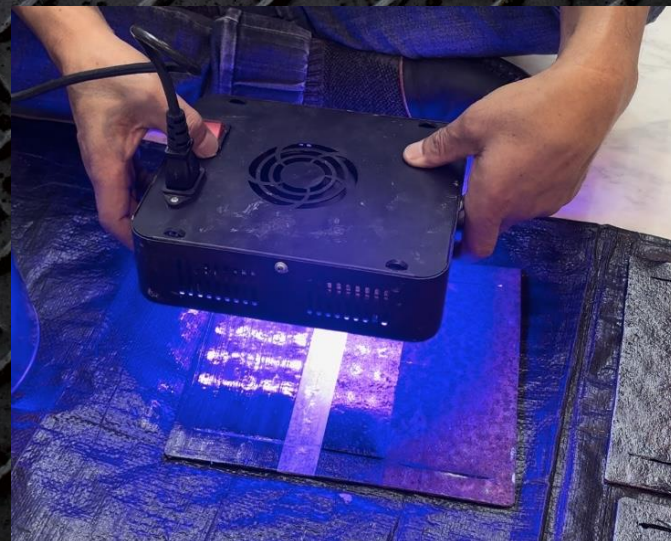
UV照射で瞬間に固まる